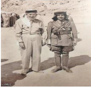
صورة للفريق سعيد جودت رئيس الحرس الملكي بالزي العسكري، ومعه طاهر الخالدي، المصدر: كتاب بعثة الطائف التدريب العسكري الأول للجيش السعودي 1363هـ/ 1944م، كرسي الأمير سلمان بن عبد العزيز للدراسات التاريخية والحضارية للجزيرة العربية، 1434هـ.